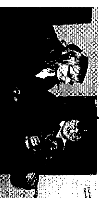
Minden nőnek egy-egy cserép virág útravalóul!

Minden év márciusában, a Nőnapon, szerepsere Balatonrendesen. A férfiak, bár szoknyát nem „húznak”, örmimmel vállalkoznak ezen a napon kiszolgáláni hivesítiket és hölgytársait. Mégve-ldégekik őket finomabhnál finomabb falatokkal, koncertet, szórakoztató műsorokat rendeznek számukra. Röviden: Tenyerükre emelik őket, ha ideig örág is csupán, hogy kifejezzék hálájukat az egész évi gondoskodásukért, szerete-tükért. Így történt ez ebben az évben is. Soha nem vállhat közhellyé, mindezt újra-és újra hangsúlyozni. A tradíció ugyanis köleszűb: már javában folyik a készűdés az „ívónapra”. Lez