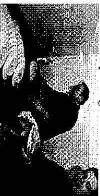
Az egyenjogűség szimbóluma Alpolgármester a mosogatónál