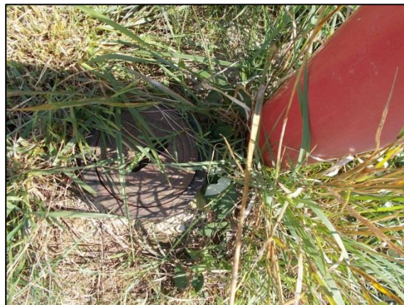
Tűzcsap – Gyöngyvirág út vége