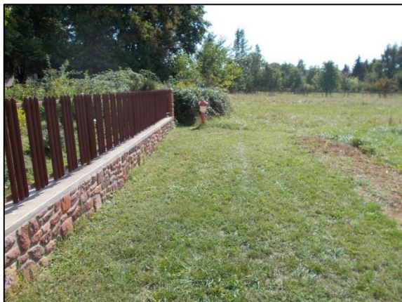
Tűzcsap – Gyöngyvirág út vége