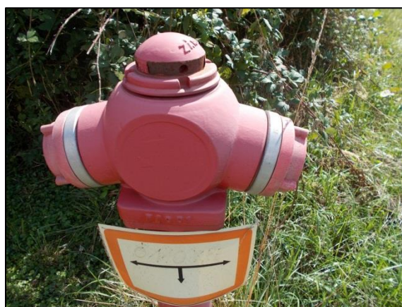
Tűzcsap – Gyöngyvirág út vége